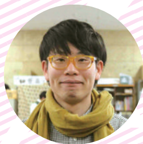
↓ NGO/NPO 新人スタッフ