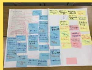
組織の課題を深掘りしながら、課題の本質を捉えるワークを行います。