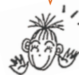
ぎたんじやりサリーちゃん

三河地方の伝統産業だった綿と、 フェアトレードで定番の オーガニックコットンを合体して、