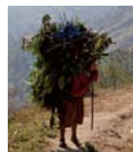
薪拾いは女性と子どもの重労働

農村の現状とは？ 課題解決のための取り組みとは？ 出会いと学びが詰まった7泊8日！