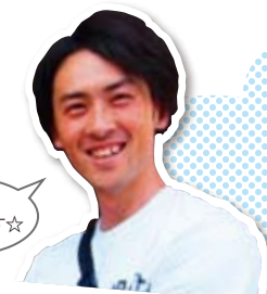
代表の デザイナーです☆

ぼくが・・・ 行っちゃいました・・・ 持ってきちゃいました・・・ 始めちゃいました!