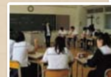
参加型ワークショップ