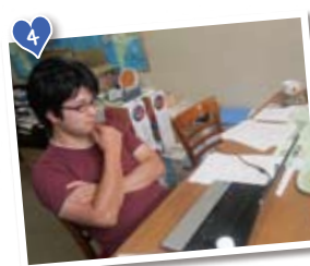
文章を書くと意外と大変。 ちゃんと伝わるかな？