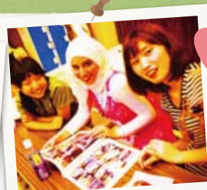
♡ガールズトーク♡ “イラクの恋愛事情” ってどんな感じ？