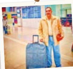
空港にお迎え！ スゴイ荷物……