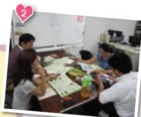
ミーティング初参戦！ よろしくお願ひしませう☆