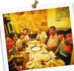
歓迎会はアラブ料理！ ☆お酒のない飲み会☆