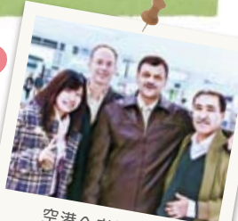
空港へお見送り 帰国後もずっと facebook やメールで やりとり☆