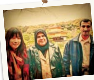
☆京都観光☆ 言葉が通じなくても 意外と何とかなる！