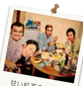
甘い紅茶を飲んで 色々なおしゃべり