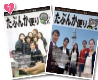
たくさんの人たちに読んでほしいな！ ニュースレターは、愛知県内を中心に 国際交流協会や大学に配布しているよ！