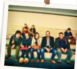
イラク人に大人気 水族館☆