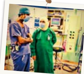
研修で手術室！ 初めて入った！