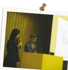
講演で通訳！語学力が 初めて人の役に 立って嬉しかった！