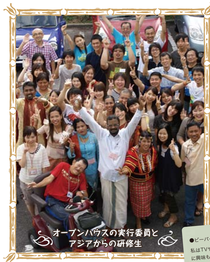
オープンハウスの実行委員と アジアからの研修生