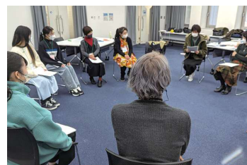
座談会形式で自由に話し合う