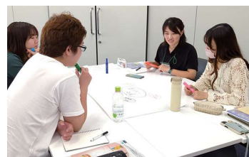
自己紹介をする研修生