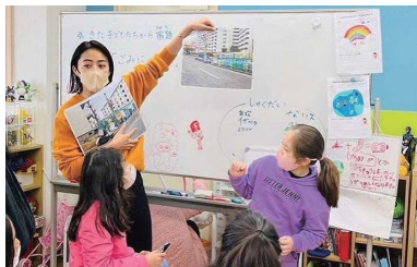
訪問先の「JUNIOS」の日本語学習支援

愛知県に住む外国籍の方は、ここ20年間で倍になり、30万人弱が生活されています。生活する上でどのような困りごとがあるのか、当事者や支援者から話を聞きます。