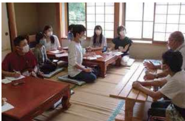
住民からのヒアリング

どのような社会をダレとどのように創るのか。「開発」という課題は、海外だけではなく、わたしたちの課題でもあり「地域の課題は世界の課題」と言えます。高山市でのまちづくりの活動を通じて参加型コミュニティ開発を学びます。