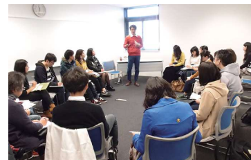
国際協力カレッジ