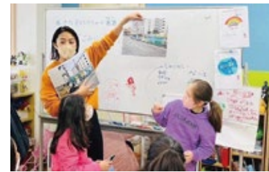
訪問先の「JUNTO」日本語学習支援

愛知県に住む外国籍の方は、ここ20年間で倍になり、2025年6月末時点で、34万人以上が生活されています。生活する上でどのような困りごとがあるのか、当事者や支援者から話を聞きます。