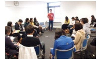
国際協力カレッジ