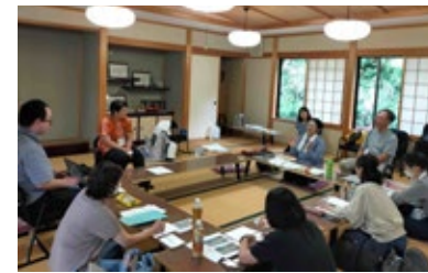
住民からのヒアリング

どのような社会をダレとどのように創るのか。「開発」という課題は、海外だけではなく、わたしたちの課題でもあり「地域の課題は世界の課題」と言えます。高山市でのまちづくりの活動を通じて参加型コミュニティ開発を学びます。